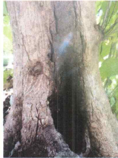
Foto 2. Vista frontal del árbol de Melina donde se aprecia la cavidad significativa.