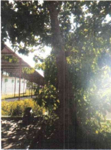
Foto 1. Vista lateral del árbol de Melina donde se logra apreciar una inclinación pronunciada hacia el techado de lámina.